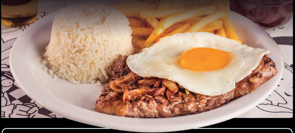
Bife à cavalo